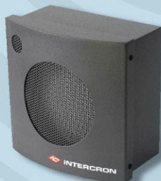
Bafle Potenciado para Exterior