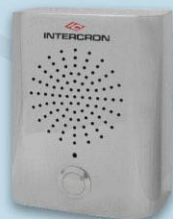
Bafle de Acero Inoxidable para intemperie